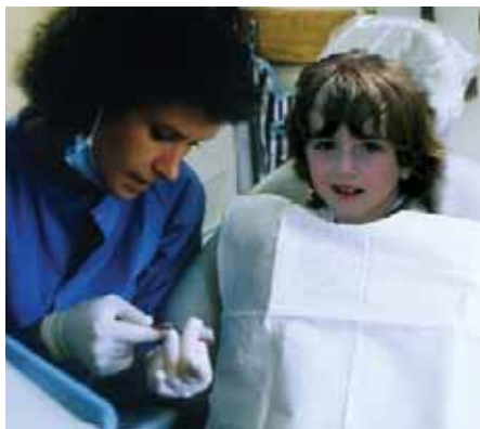
La higienista enseña como cepillarse los dientes correctamente

Me gustaría compartir con usted una historia que ocurrió hace un par de años cuando era voluntaria en la Escuela Elemental Liberty. Tuve la oportunidad de conocer a una joven a quien los dentistas de PRASAD iban a hacerle un trabajo dental. Llevé a esta mujer a la unidad móvil de PRASAD y se la veía encantada porque PRASAD iba a darle una nueva sonrisa e iba a estar guapa otra vez. A ella le gustaba mucho ir al dentista porque le hacía sentirse especial.