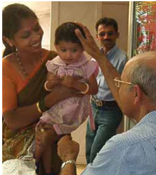
Una madre y su hijo en el Centro de Salud Familiar

Con más de mil millones de personas, la población de la India sigue creciendo a razón de un 2% anual, lo que supone más de 17 millones de personas más cada año, y una natalidad diaria de más de 70.000 bebés. Gran parte de la población reside en la India rural, donde el acceso a un servicio sanitario de calidad es bastante limitado.