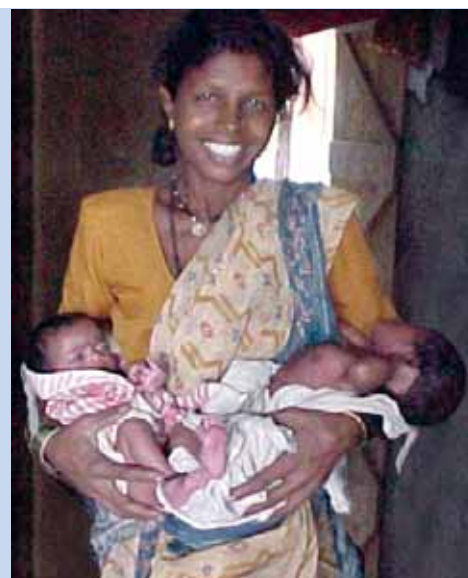
Una madre sonríe mientras posa con sus gemelos sanos.

Gracias a los esfuerzos de PRASAD, se ha convertido en algo poco común que los bebés de las madres inscritas en el programa RCH de PRASAD, nazcan con menos de 2,5 kilos de peso. La gran mayoría de los bebés nacen con un peso medio de 3 kilos o más.